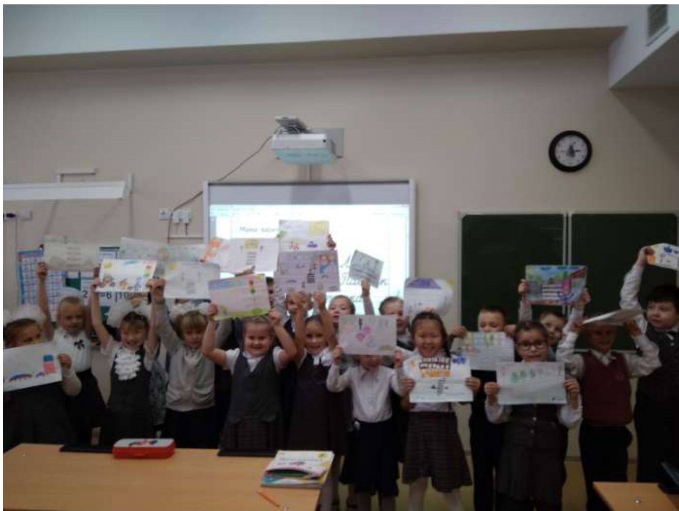
3 В класс